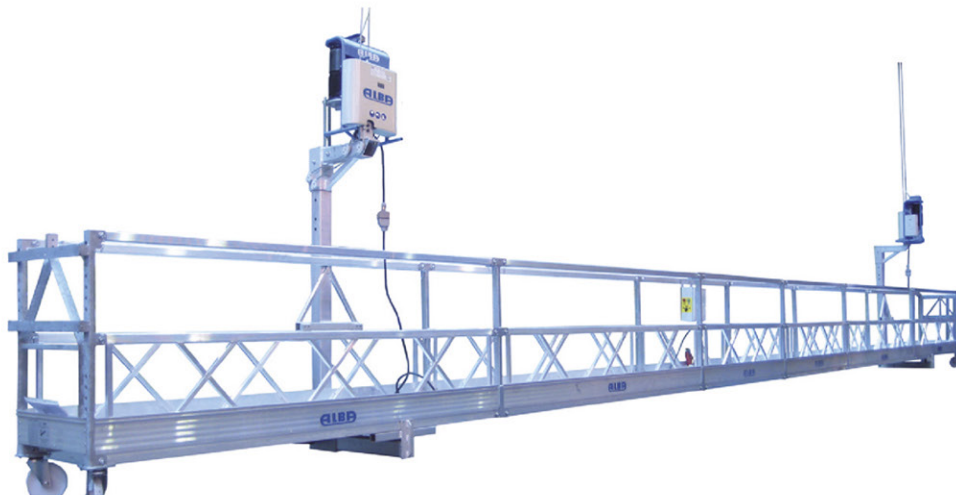
PLATAFORMA DE ALUMINIO

Mod. 2HE-CAB-150 CABLE DE 9.5 MM 150 MTS, PESO 75.00 Kg.