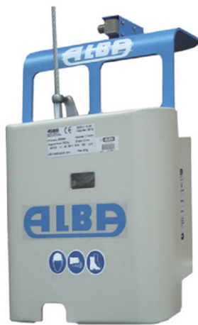
APAREJO ELÉCTRICO TRIFASICO 60 HZ Mod. AE-800 PESO 78.00 Kg.